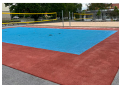
8. Volleyboll och beachvolley på samma plats, men vilken plats är det?