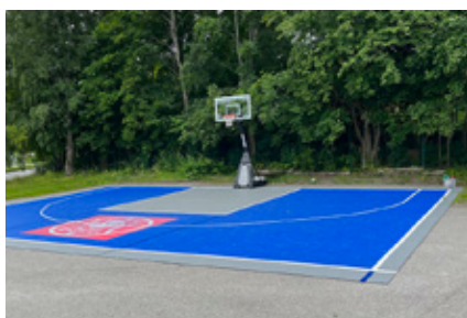
4. Oj, den här var ny! Basket mot en korg, men var?