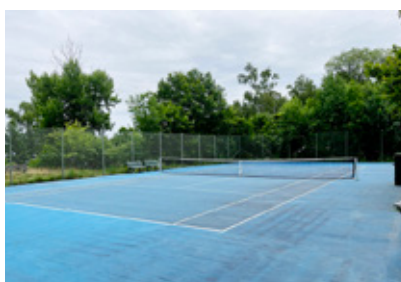
5. Och så blir det tennis igen. Var finns denna bana?