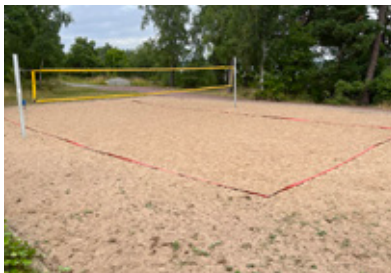
2. Här är frågan beachvolley, men var?