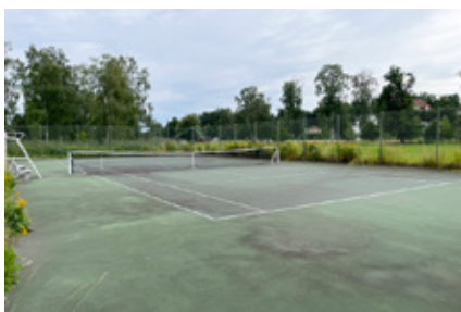
1. Vi börjar med tennis. Var finns denna bana?

Glöm inte att skriva ditt namn och epostadress. Senast den 31 augusti vill vi ha ditt svar. Denna månad kostar det inget att vara med. Och det enda du kan vinna är äran. Vi publicerar svaren på de tre första vinnarna den 1 september. Nästa tävling kommer den 2 september.