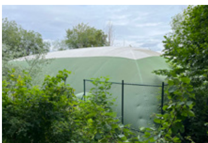
10. Tennis igen, denna gång en inomhushall, men var gömmer sig den?

Vill du bidra med en fråga? Skicka in din bild (och facit) så kan du vara med och skapa nästa månads rebusjakt: info@lidingonyheter.se Bildrebusjakten är ett samarbete mellan Lidingö Nyheter och Lidingö Hembygdsförening.