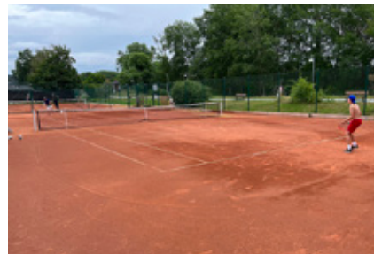
3. Dags för tennis igen. Var?