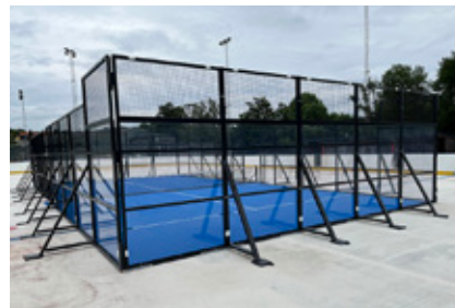
6. Den här padel-banan finns definitivt inte kvar i vinter. Var stod den i juli?