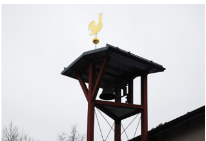
4. Ledtråd: Birka för länge sedan. Vad heter byggnaden?