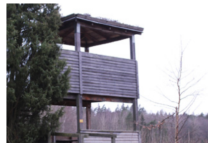
9. Hur många personer får vistas samtidigt i detta torn enligt skylten? Det vet fåglarna!