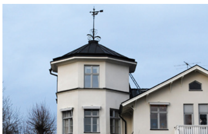
1. Tornet syns både från kunglig väg och östlig färjeled. Vad heter den lilla skulpturen vid vattenbrynet i närheten?

Vill du bidra med en fråga? Skicka in din bild (och facit) så kan du vara med och skapa nästa månads rebusjakt: info@lidingonyheter.se Bildrebusjakten är ett samarbete mellan Lidingö Nyheter och Lidingö Hembygdsförening.