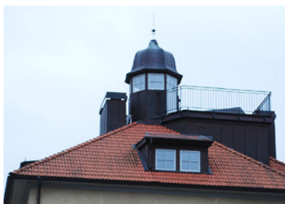
5. Denna adress kan man förknippa med vinterlandskap och fisk. Vilket nummer står på brevlådan?