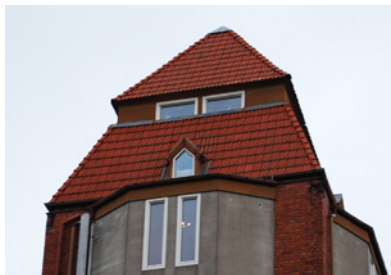
2. Här kunde man förr ta sig vatten över huvudet. Vem har ritat huset? Svaret finns på platsen.