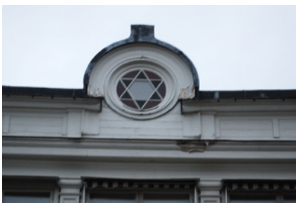
7. Här intill firar vi minnet av en skald varje år. Vilket årtal står på fasaden på andra sidan huset?