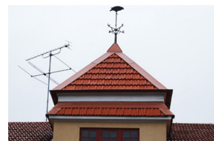
12. Borta bra men hemma bäst. Både förr och nu. Vad är det för verksamhet här?