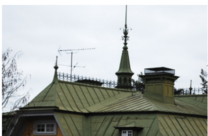
10. Ledtrådar: 1895. Livmedikus. Älskande par. Vad heter huset?