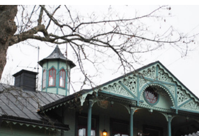
11. Här fick man förr se upp så man inte flög i luften. Han som lät bygga huset har en väg i närheten. Men vad kallas huset, som uppkallats efter hans hustru?