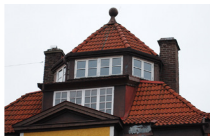
3. Vilken utsikt man har från detta torn! Man kan ana både sol, måne och stjärnor härifrån. Vad heter vägen?