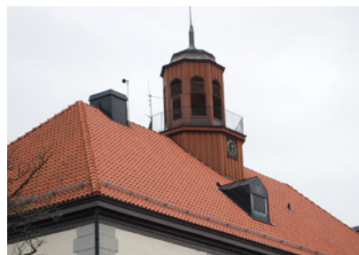
8. Ärorik och lärarik byggnad. Vad heter de två vägarna som korsas närmast?