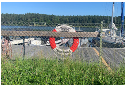
4. Lidingös minsta båtklubb?