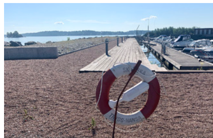
3. Ute på ön till vänster finns Neptuniordern.