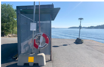
1. Semaforen faller man upp om man vill att Vaxholmsbåten ska stanna till.

Du deltar genom att svara på formuläret som finns på Lidingö Nyheter hemsida och betala in 94 kr på Swish nr 123 253 55 99 Glöm inte att skriva ditt namn och epostadress. Senast den 31 juli vill vi ha ditt svar. Vi delar ut två priser, dels till den första inlämnade rätta lösningen, dels till en som vi lottar ut bland övriga rätta lösningar. Rätta svar kommer den 1 augusti och nästa tävling kommer den 2 augusti.