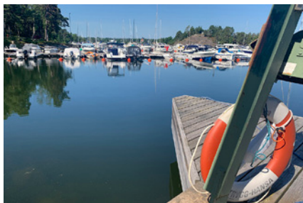
7. En lång promenad leder hit.