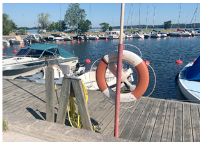
8. Förkortas rumpa, på engelska.