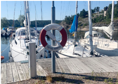
5. Bredvid Klipp, mitt emot Hassel.