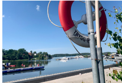
6. Båttvätt finns.