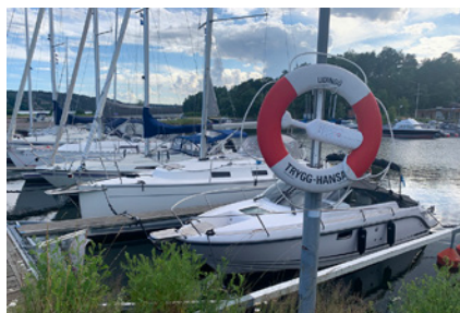
10. Detta är nog den vackraste bilden, tycker redaktören...

Vill du bidra med en fråga? Skicka in din bild (och facit) så kan du vara med och skapa nästa månads rebusjakt: info@lidingonyheter.se Bildrebusjakten är ett samarbete mellan Lidingö Nyheter och Lidingö Hembygdsförening. Fotograf och konstruktör: Andreas Lindberg.