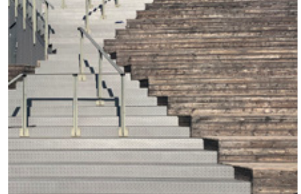
6. Den här frågan är väl ingen match?