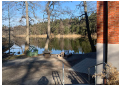
8. Här använde man förr ozon.