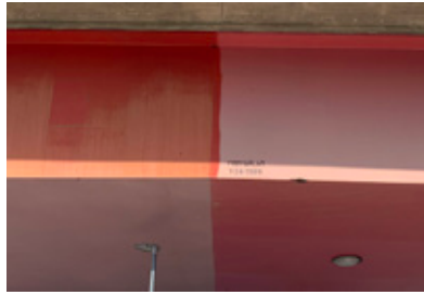
2. 38 år sedan de provmålade, kan de inte bestämma sig?