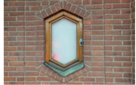
3. Nära uttag och intag.