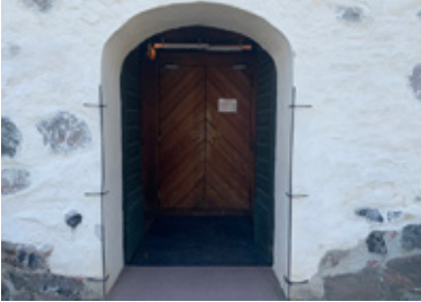
1. Här finns kor, men de säger inte mu.

Pris är två presentcheckar från en Lidingöbutik, värda 500 kr/st denna månad.