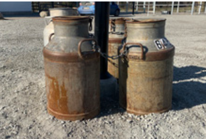
7. Mjölken har nog surnat, men här har man ett hästjobb.