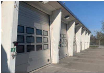
5. Tuppen vakar över denna byggnad.