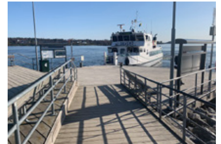
9. Nästa Hasseludden.